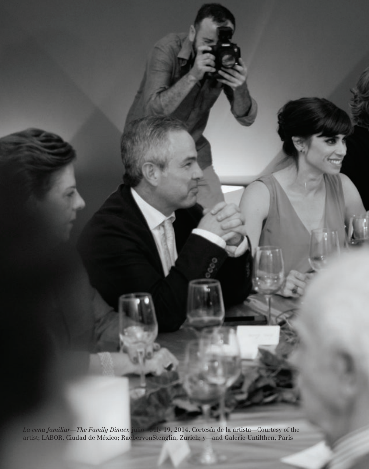
La cena familiar—The Family Dinner , julio—July 19, 2014, Cortesía de la artista—Courtesy of the artist; LABOR, Ciudad de México; RaebervonStenglin, Zurich; y—and Galerie Untilthen, Paris