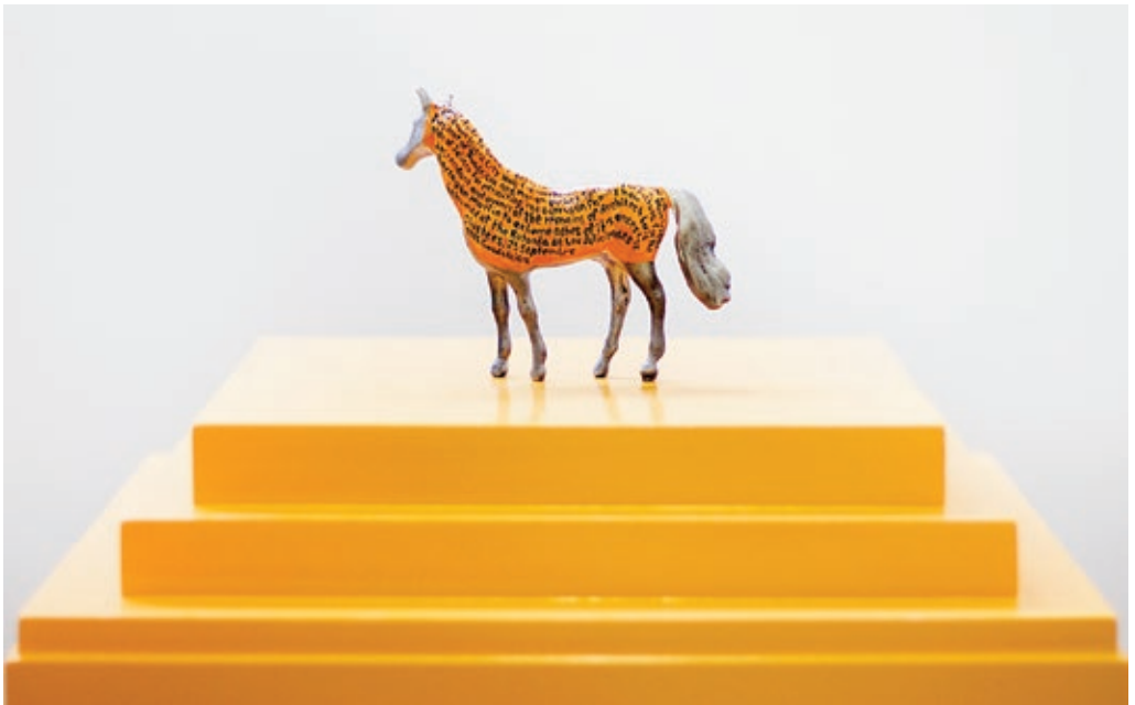
Arriba—Top: Ex-Voto: Milagro de la familia—Ex-Voto: Miracle of the Family , 2016. [Cat. 11]