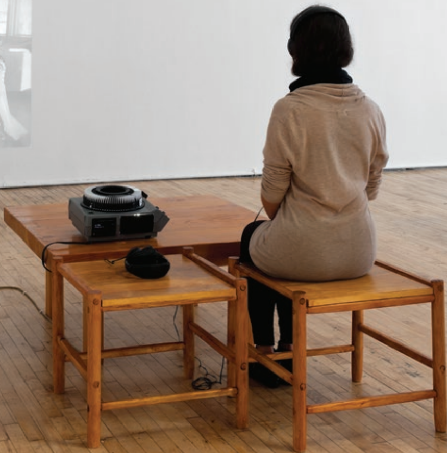
Querida Federica—Dearest Federica , 2013. [Cat. 31]