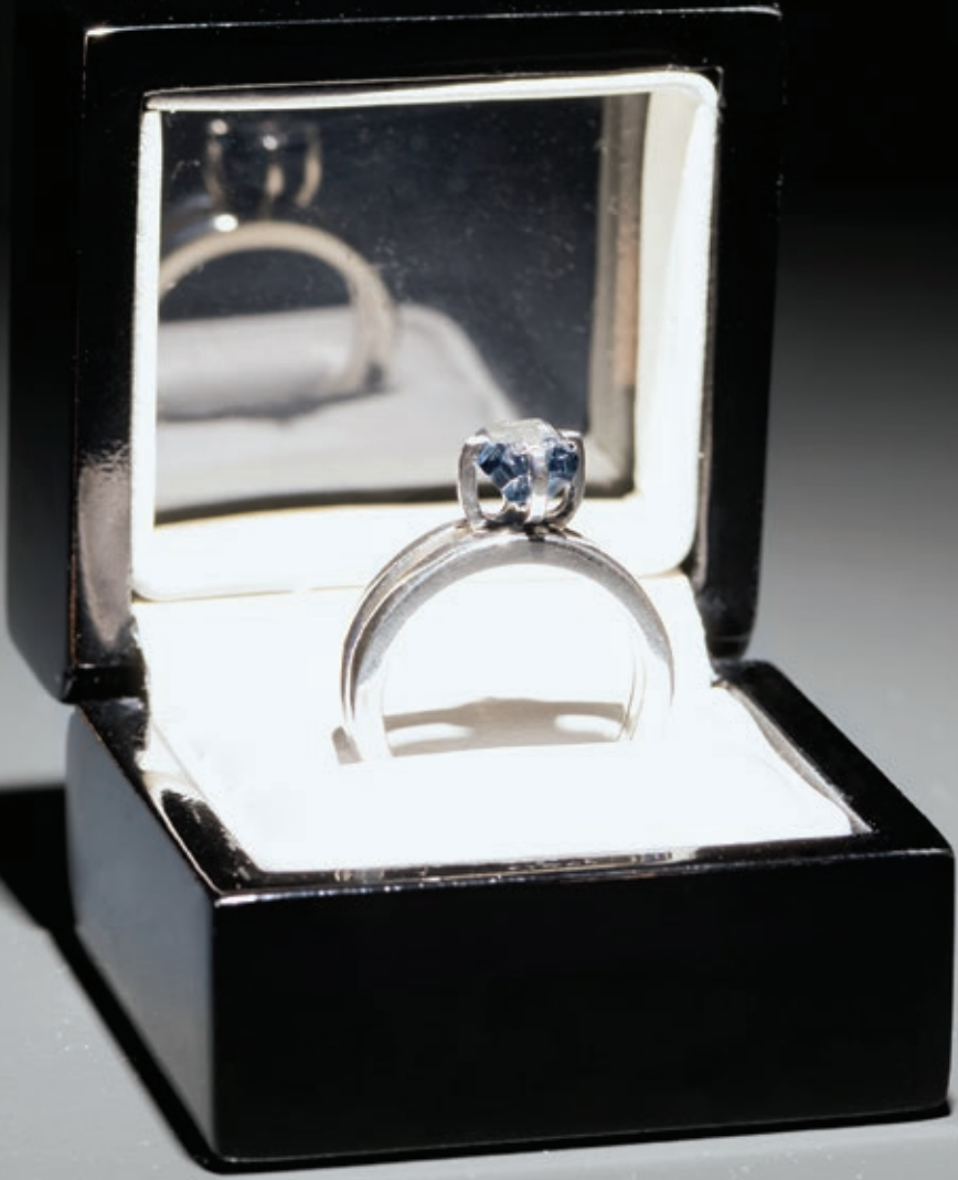
La Propuesta—The Proposal , 2014–2016 [Cat. 19]