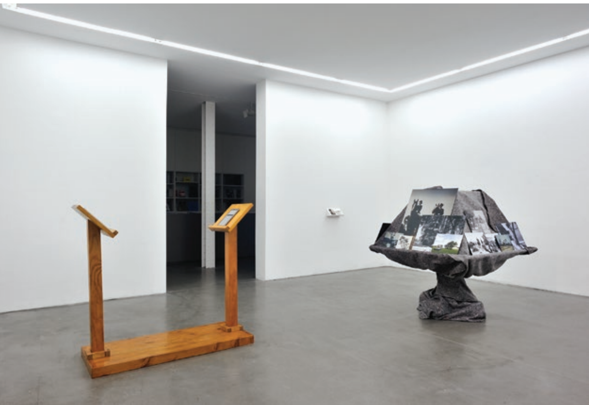
Vista de la exposición—Exhibition view Woman with Sombrero , Yvon Lambert, Paris, 2014