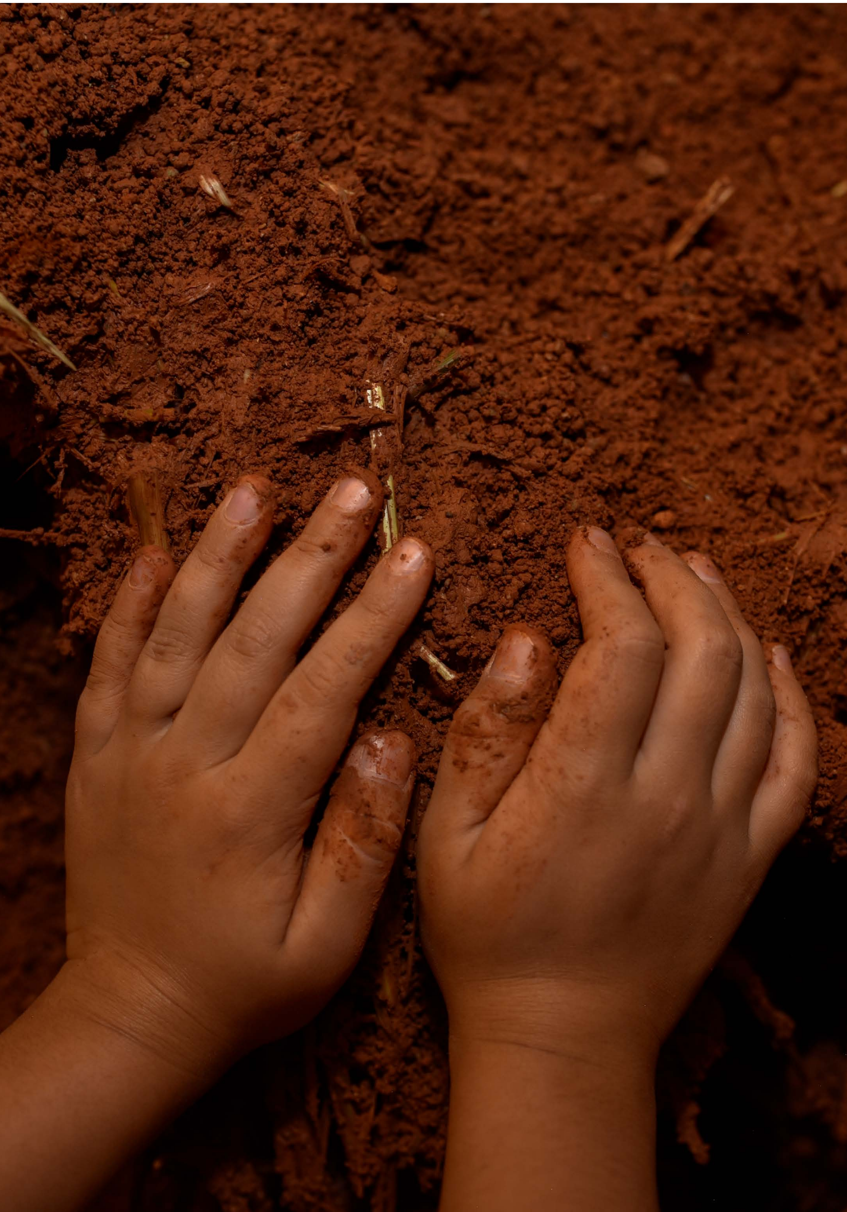
El espacio vientre , 2025. Detalle.