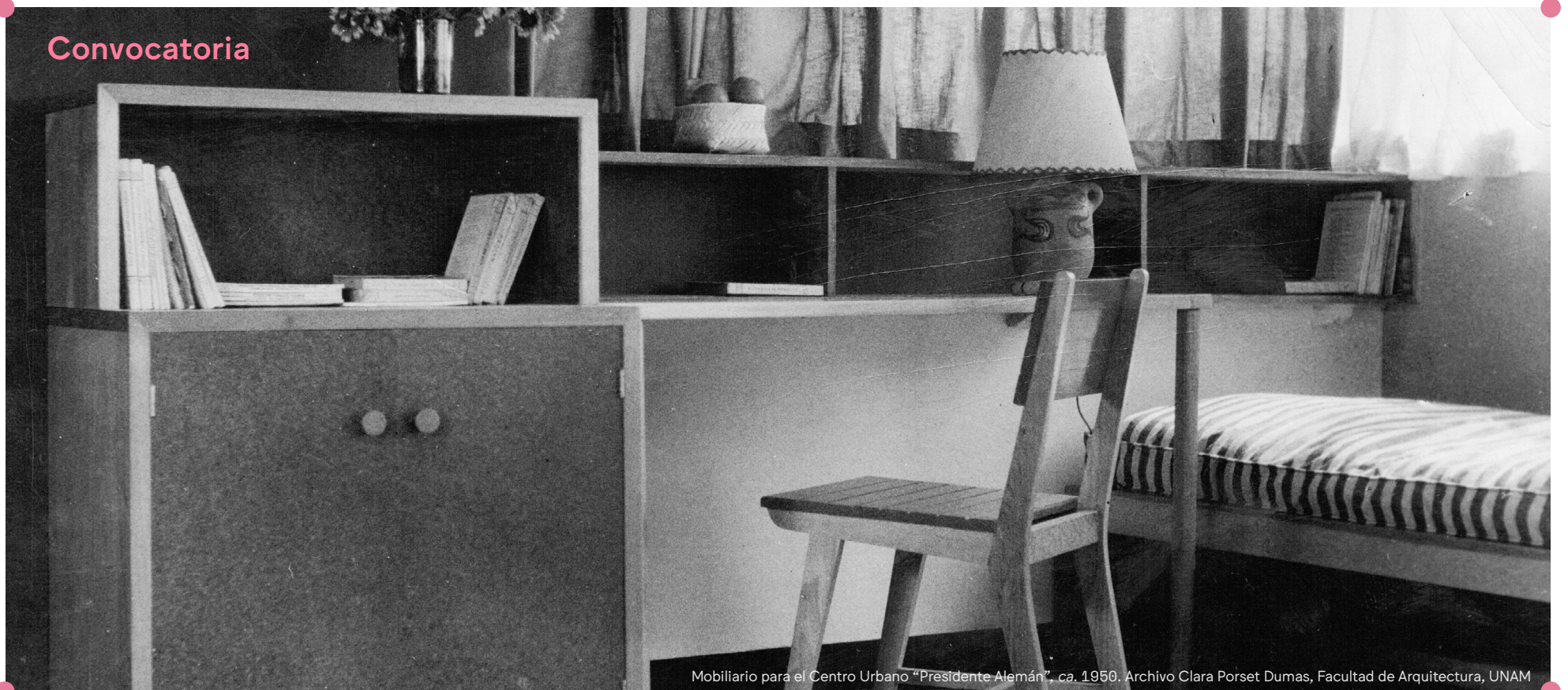
Mobiliario para el Centro Urbano "Presidente Alemán", ca. 1950.